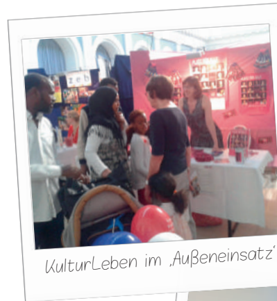
KulturLeben im „Außeneinsatz“