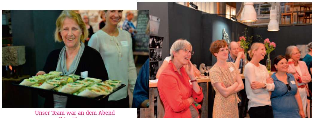
Unser Team war an dem Abend voll im Einsatz ...

Wir feierten mit gut 150 Freundinnen, Freunden und Förderern aus Politik, Kultur, öffentlicher Verwaltung und Sozialwirtschaft in der Halle 424 im Oberhafenquartier unseren 5. Geburtstag.