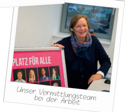
Unser Vermittlungsteam bei der Arbeit