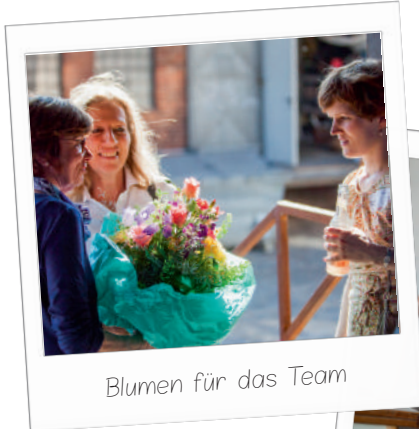
Blumen für das Team