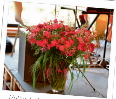
KulturLeben Hamburg e.V. sagt Dankel

... sowie bei allen privaten und privatwirtschaftlichen Spenderinnen und Spendern, die unsere Arbeit im Jahr 2016 unter anderem über die Spendenplattformen betterplace.org und gooding.de mit vielen weiteren Spenden ermöglicht und begleitet haben!