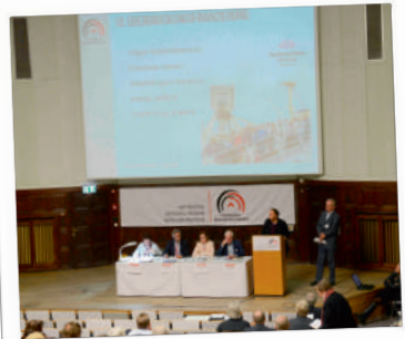
Für unsere gute Sache im Hamburger Spendenparlament